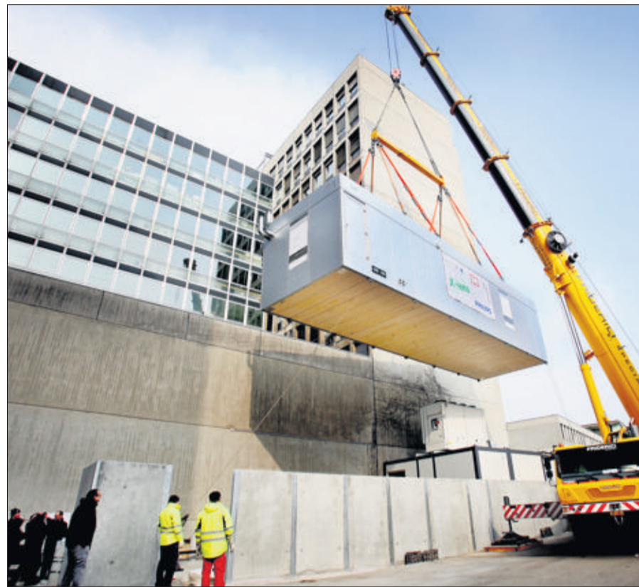
Monstre de technologie. Les Hôpitaux universitaires de Genève se sont fait livrer, par grue samedi matin, le premier scanner PET-IRM d'Europe. (MAGALI GIRARDIN)