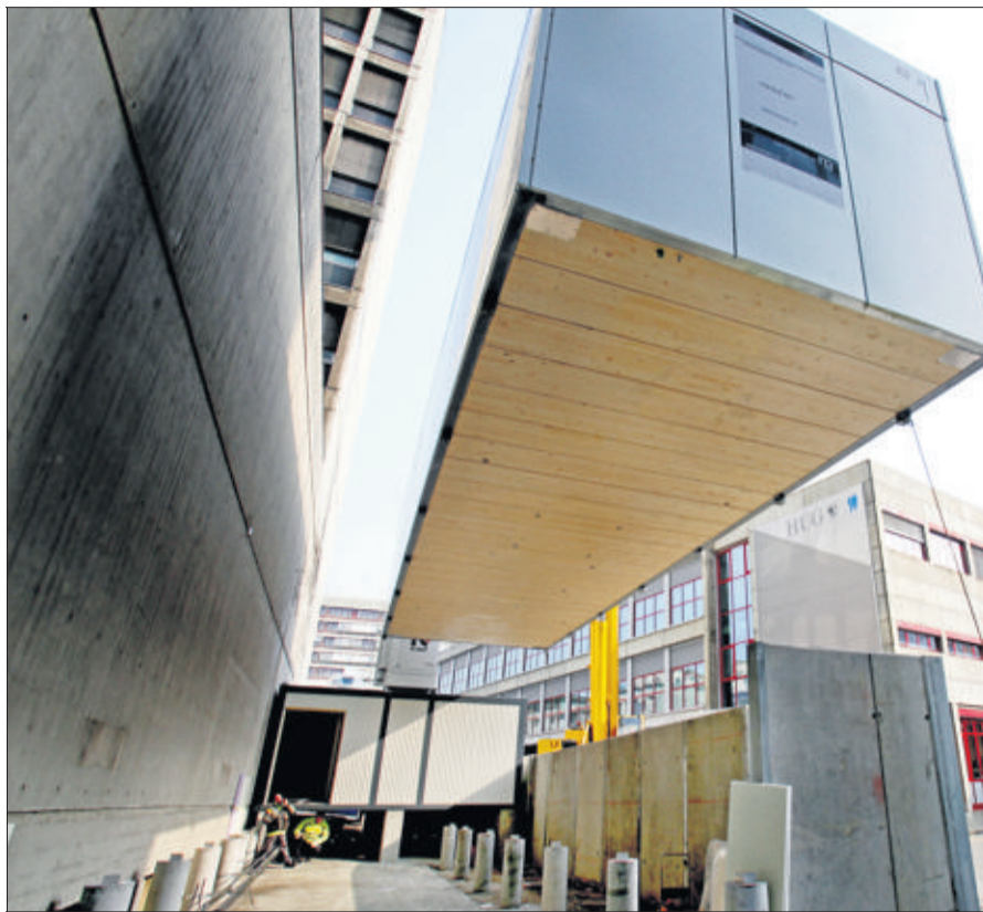
Emballage cadeau. Livrée dans un container, la machine flambant neuve s'intègre au bâtiment de l'Hôpital. L'unique autre appareil se trouve à New York.

SANTÉ Samedi, les HUG installaient un appareil destiné à améliorer l'efficacité des traitements contre le cancer.